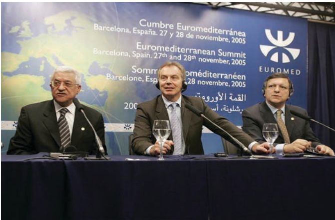
Abb. 2 Pressekonferenz 27.11.2005 (Frontstage)